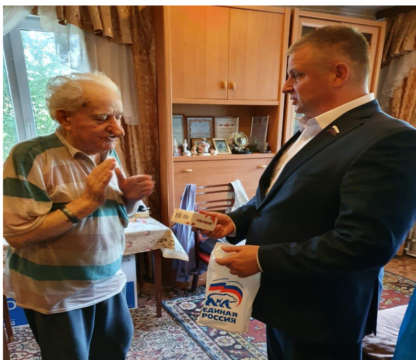
Участие в благотворительной акции по вручению мобильных телефонов с безлимитной сетью ветеранам и участникам Великой Отечественной войны. Телефоны оснащены большим циферблатом и специальной тревожной кнопкой на случай экстренной ситуации.