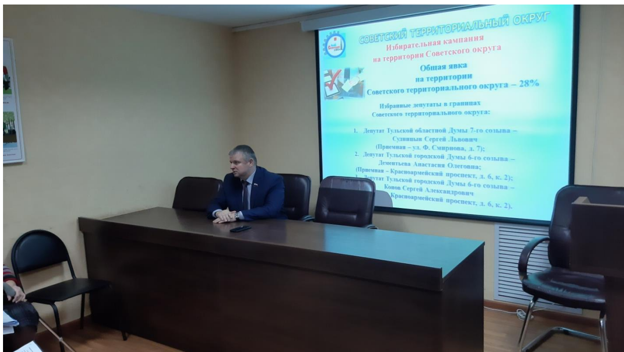
Встреча с активом Советского территориального округа

За отчетный период многократно встречался с избирателями и активом Советского территориального округа, проводил рабочие встречи с жителями, регулярные личные приемы.