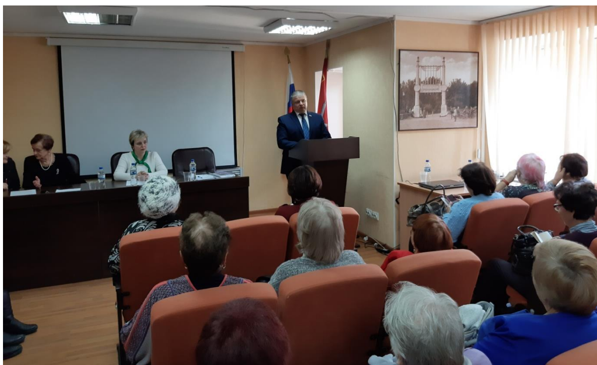
Конференция Союза пенсионеров Советского территориального округа