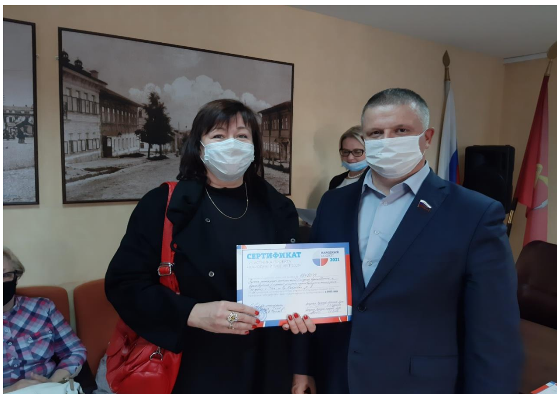
Вручение сертификатов участникам проекта "Народный бюджет" в Советском территориальном округе