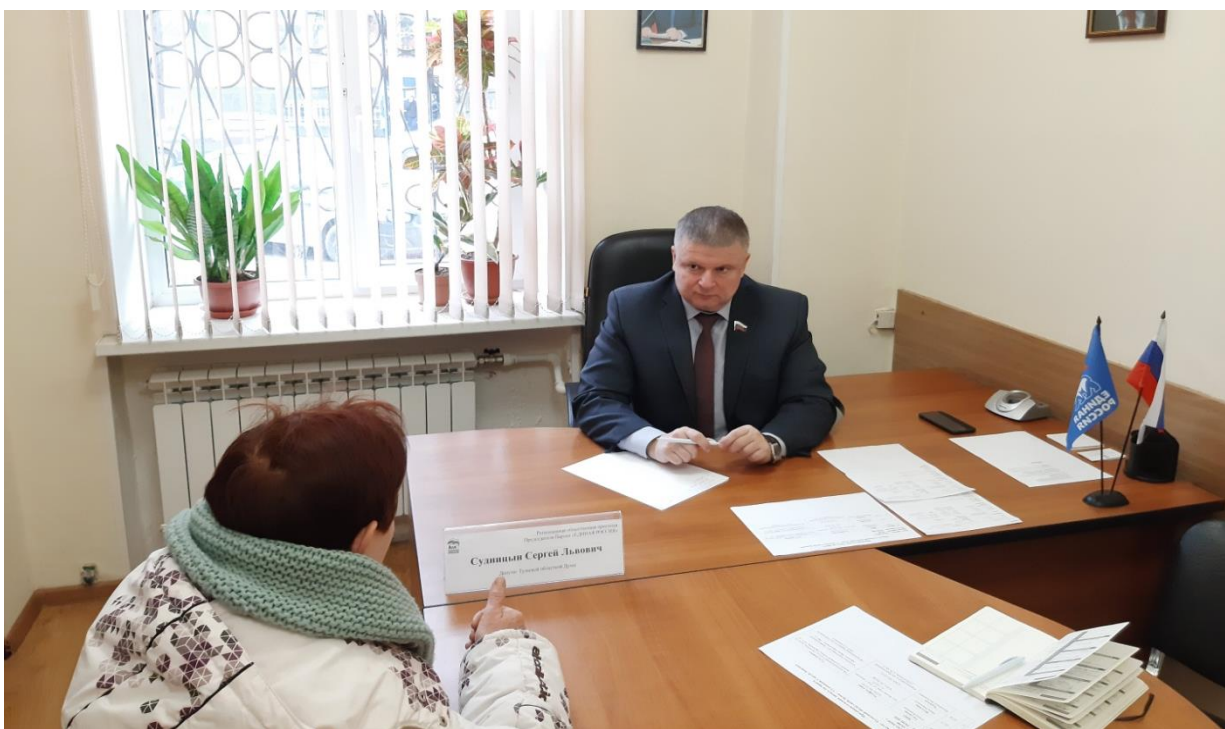
Прием граждан в Региональной общественной приемной председателя партии "Единая Россия"