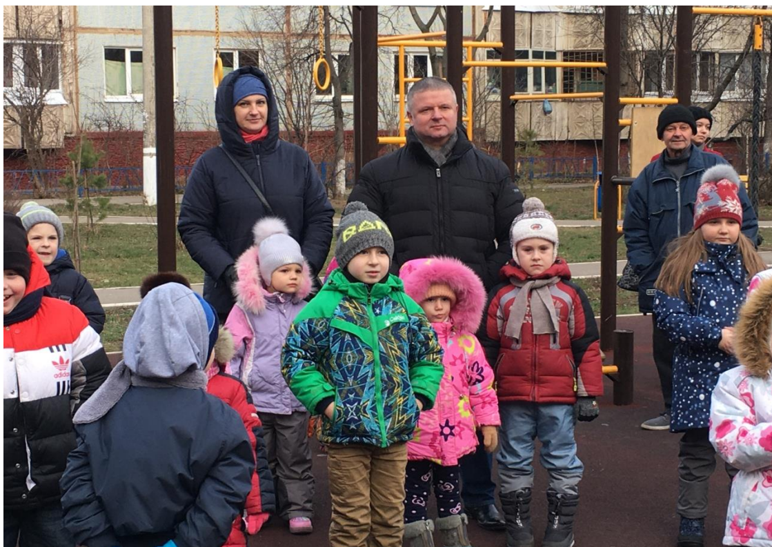
Праздник двора (ул. Лейтейзена, 8)