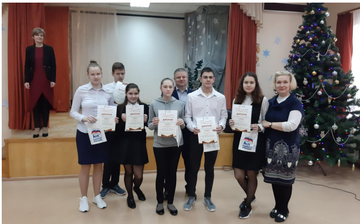
Награждение победителей муниципального этапа конкурса творческих работ "Память" (ГОУ ТО "ТОЦО")

За отчетный период регулярно принимал участие в заседаниях фракции, акциях и мероприятиях проводимых фракцией регионального отделения партии на территории области, заседаниях Общественного совета партии "Единая Россия" в Советском территориальном округе, проводил личные приемы в Региональной общественной приемной председателя партии "Единая Россия" в Тульской области, принял участие в декаде приемов, посвящённых 19-летию создания Всероссийской политической партии "Единая Россия".