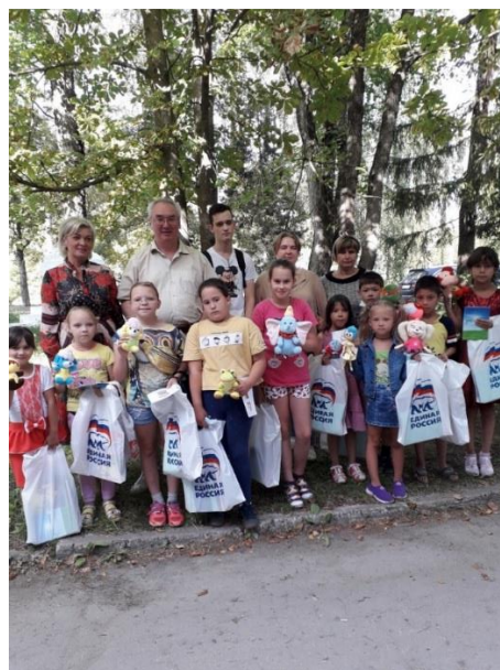
Вручение подарков первоклассникам в поселке Ленинский.