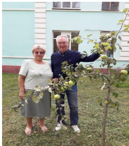
Центр образования №5 города Тулы