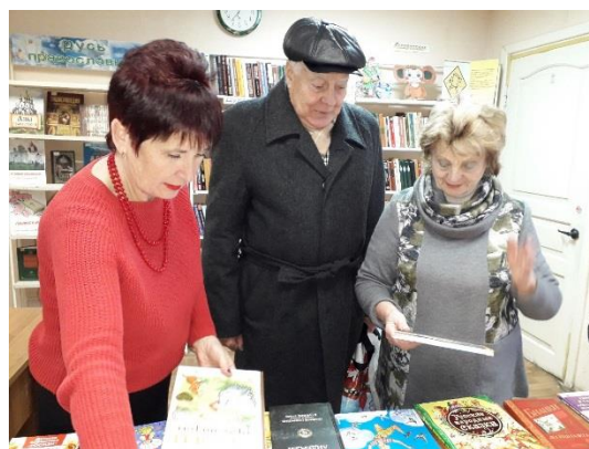
Библиотека поселка Плеханово