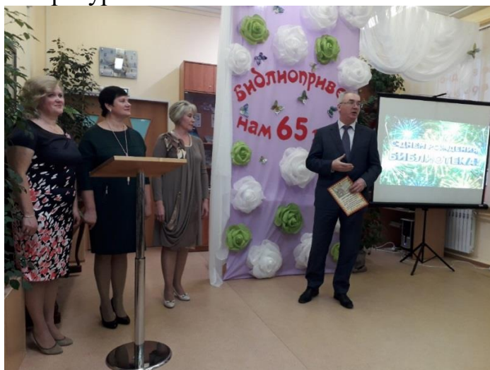
Библиотека №3 имени Н.Ф.Руднева города Тулы

Так, на торжественном собрании, посвященном 65 - летию модельной библиотеке №3 имени Н.Ф.Руднева города Тулы, Михаил Евгеньевич вручил коллективу библиотеки сертификат на приобретение новой художественной литературы.