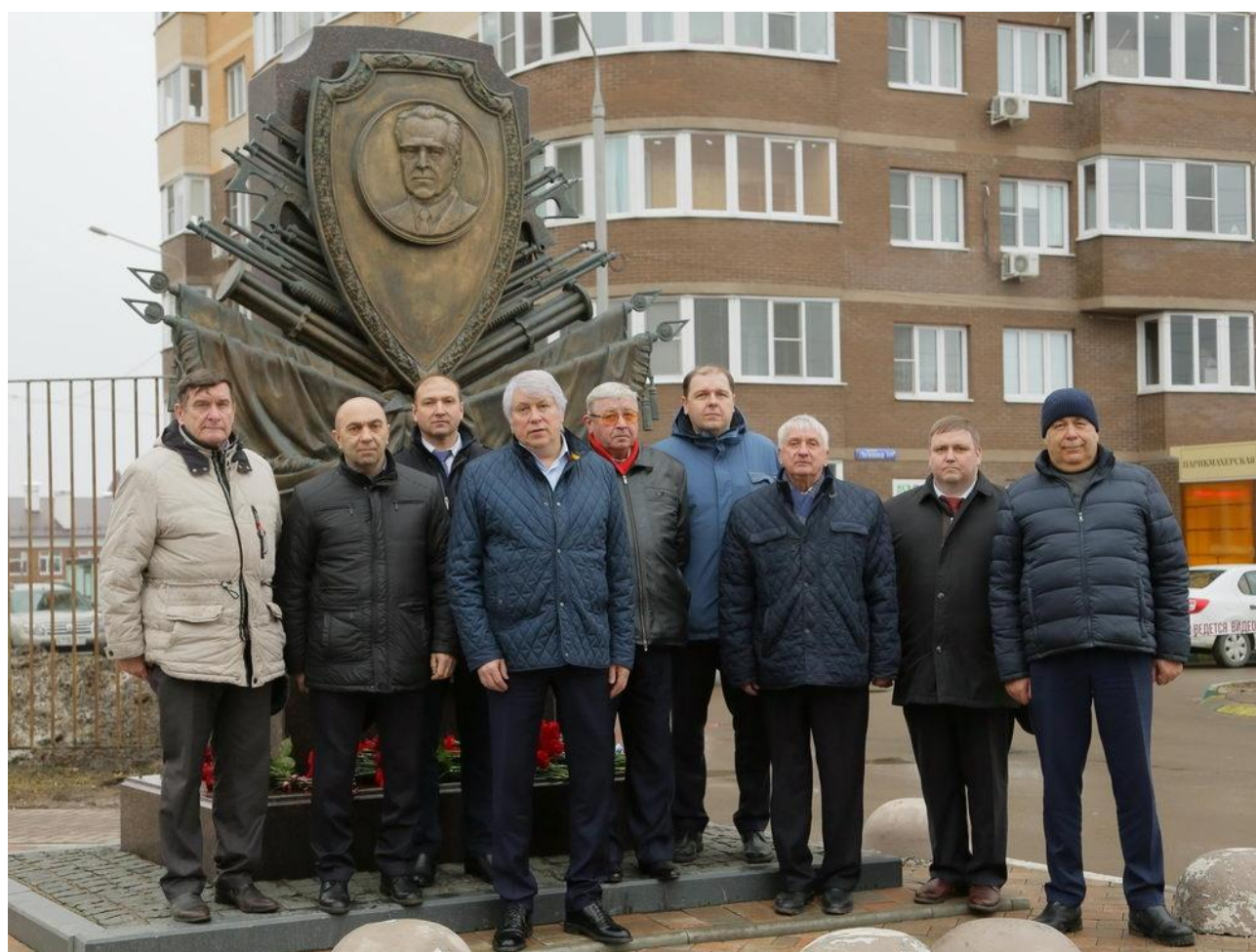
Депутат областной Думы, ректор ТулГУ возложил цветы к Стеле памяти на территории студгородка.