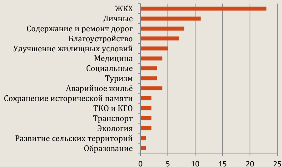
Частые темы обращений граждан:

Но остались и нерешенные вопросы, которые буду держать на контроле и добиваться положительного результата: ремонт дороги к селу Смородино и по улице Линейная Узловского района.