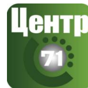
СИ «Центр» 71