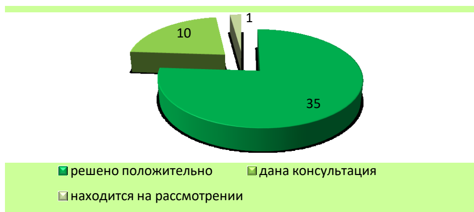
Диаграмма 2. Сведения об итогах рассмотрения обращений, поступивших мне в 2018 году.

Необходимо отметить, что, как и в прошлые годы, вся работа по обращениям граждан проводится в тесном взаимодействии с органами местного самоуправления, органами исполнительной власти Тульской области, уполномоченным по защите прав человека в Тульской области. Большинство вопросов, с которыми приходят граждане на прием, относятся к компетенции именно этих органов, и, как правило, гражданин просто не знает, куда он может обратиться с тем или иным вопросом.