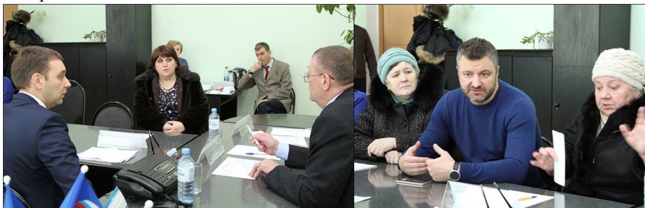
Прием граждан 12.02.2018 года в общественной приемной в городе Алексине

пользуются туалетом, который расположен на улице. Помимо этого неудобства, в настоящее время деревянный туалет пришел в полную непригодность из-за ветхости. Мои переговоры с ресурсоснабжающей организацией МУП «ВКХ г. Алексин» и управляющей компанией, осуществляющей управление данным домом, помогли решить вопрос по установке во дворе дома заявительницы нового туалета. Однако позже потребовалось мое дополнительное участие в решении этого вопроса, так как организации, проведя установку нового туалета, крайне некачественно демонтировали старый, и выгребная яма не была вычищена и надлежащим образом закрыта. Только в ноябре 2018 года данный вопрос был снят с контроля.