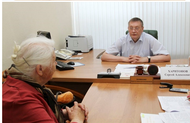
Прием граждан 27.06.2018 года в приемной Президента Российской Федерации в Тульской области

Вопросы, связанные с благоустройством придомовой территории, территории микрорайонов, в которых проживают граждане, - это те вопросы, которые наиболее часто поднимают в своих обращениях заявители. Всегда приятно помогать таким людям, которые радеют за свой двор, свою улицу, свой город. Так, ко мне на прием, проводившийся 12.02.2018 года в общественной приемной в городе Алексине, обратилась заявительница, проживающая в городе Алексине, которая просила помочь в решении вопроса благоустройства придомовой территории дома № 8, расположенного на улице Болотова в городе Алексине. Благодаря помощи представителей администрации муниципального образования город Алексин данная придомовая территория была благоустроена в рамках реализации программы «Формирование современной городской среды».