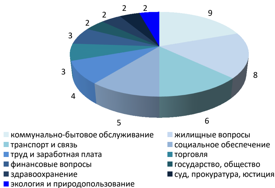
Диаграмма 1. Количество обращений, поступивших мне в 2018 году, с разделением по тематике.

Соотношение количества обращений, с которыми ко мне обращались граждане в 2018 году, по их тематике приведено в диаграмме 1.