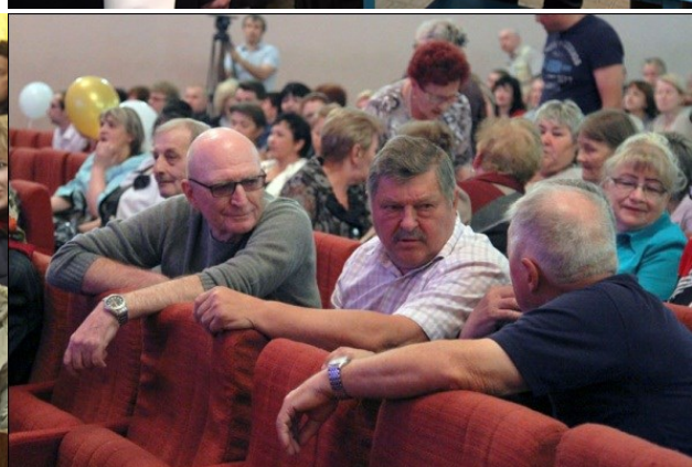
Встречи с работниками различных предприятий Тульской области в 2018 году

Работа с избирателями не останавливается на проведении приемов граждан, проживающих в моем избирательном округе. За пять лет деятельности Тульской областной Думы 6-го созыва мы стали друг другу хорошими друзьями. 2018 год не стал исключением в этом. Мы вместе работаем и отдыхаем. Так, в 2018 году я вместе с жителями моего округа принимал участие в субботниках, направленных на уборку и благоустройство территории, приведение в порядок памятников, восстановление лесных и парковых насаждений.