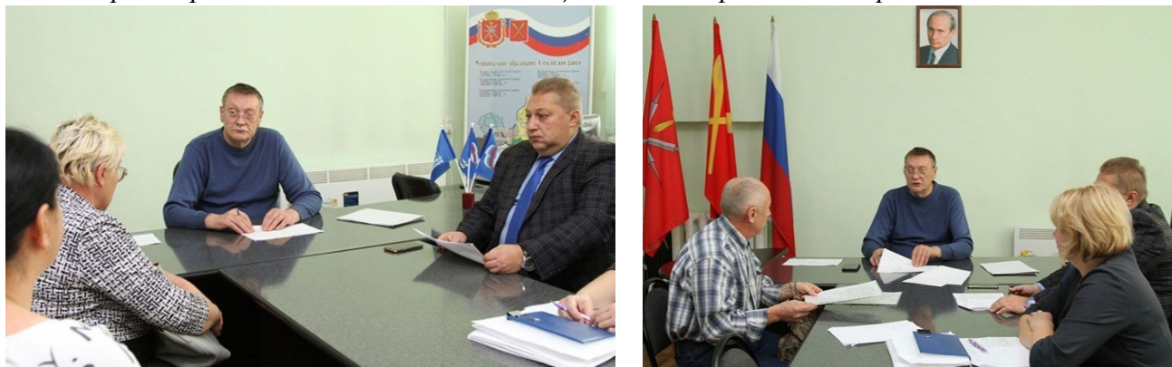
Прием граждан 09.10.2018 года в общественной приемной в городе Алексине

Моя работа с избирателями также проводилась в форме встреч с трудовыми коллективами промышленных предприятий и организаций Тульской области. Всего за 2018 год я посетил около 20 организаций и предприятий, расположенных на территории Тульской области, в том числе: поликлинику № 5 Алексинской районной больницы № 1 (07.02.2018), ООО «Авиаген», ООО «ИЭК МЕТАЛЛ-ПЛАСТ» (15.02.2018, Ясногорский район), ЗАО «Болоховский хлебозавод» (27.02.2018, Киреевский район), АО «Тульский завод РТИ» (28.02.2018, город Тула), АО «Алексинский опытно-механический завод» (02.03.2018 и 27.09.2018), ФКП «Алексинский химический комбинат» (25.05.2018), ЗАО «Кимовский завод металлоизделий») (29.05.2018), АО «Щекиноазот» (01.06.2018), ООО