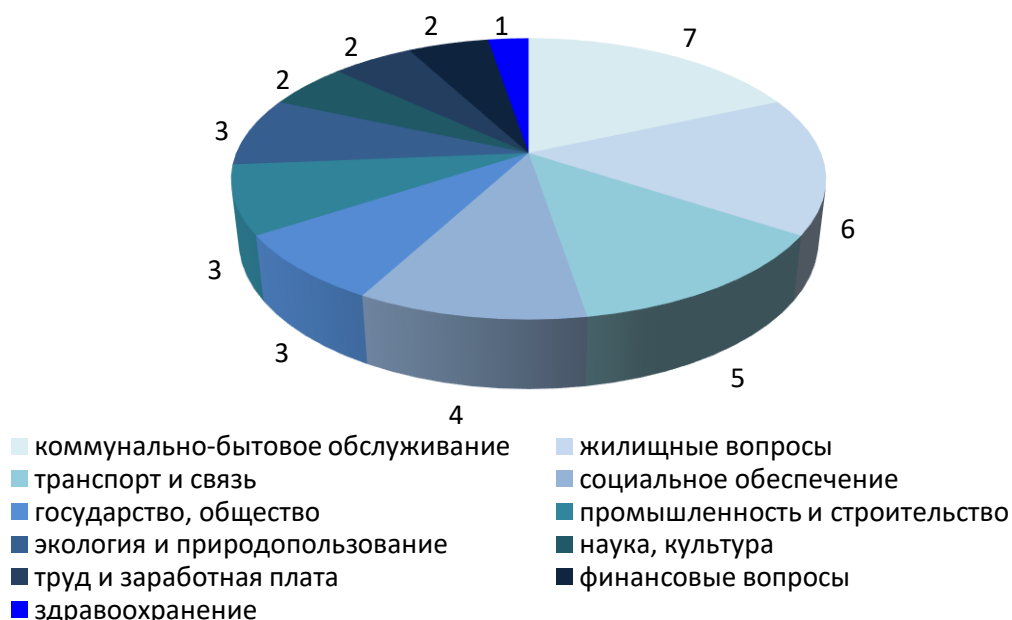
Диаграмма 1. Количество обращений, поступивших мне в 2017 году, с разделением по тематике.

Соотношение количества обращений, с которыми ко мне обращались граждане в 2017 году, по их тематике приведено в диаграмме 1.