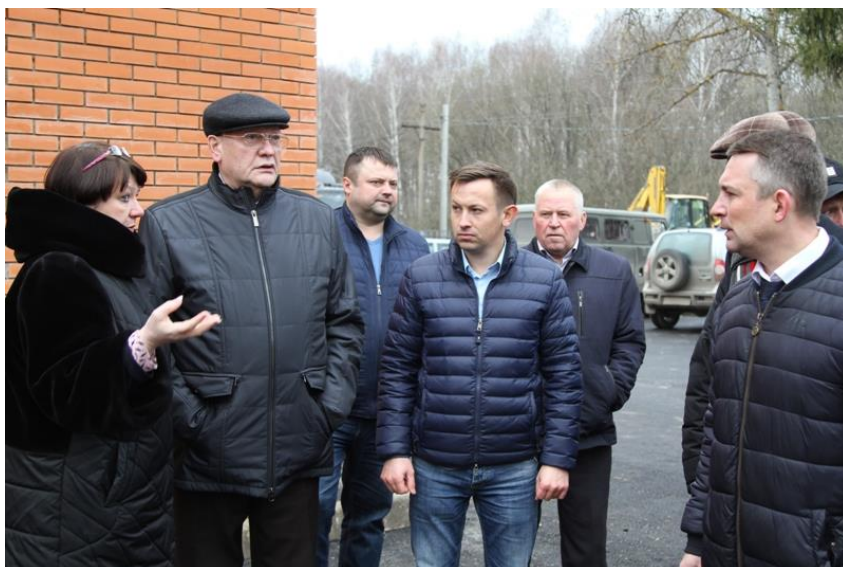
Осмотр строительной площадки по возведению Дома культуры в поселке Пахомово Заокского района (30.11.2017)

направлений моей депутатской деятельности. К моему избирательному округу относятся территории следующих муниципальных образований: Заокский район, городской округ Алексин, рабочий поселок Новогуровский и поселок Обидимо. В каждом из них созданы и постоянно действуют мои общественные приемные, а личный прием граждан осуществляется еженедельно, по пятницам. Помимо этого, провожу приемы граждан в общественной приемной Президента Российской Федерации в Тульской области, в общественных приемных правительства Тульской области, в Региональной общественной приемной Председателя партии «Единая Россия» в Тульской области. Кроме того, много обращений приходится принимать «на ходу», когда граждане обращаются, например, по окончании встречи с активом в одном из муниципальных образований области или по окончании иного официального мероприятия.