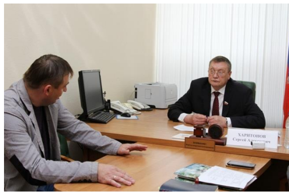
Прием граждан 09.06.2017 в приемной Президента Российской Федерации в Тульской области