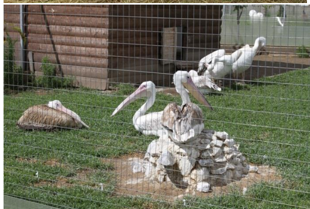
День поля, который в 2017 году проводился на территории Алексинского района около деревни Казначеево, на базе ООО «Алексин-Страус»

Работа с избирателями не останавливается на проведении приемов граждан, проживающих в моем избирательном округе. За четыре года деятельности Тульской областной Думы 6-го созыва мы стали друг другу хорошими друзьями. 2017 год не стал исключением в этом. Мы вместе работаем и отдыхаем. Так, в 2017 году я вместе с жителями моего округа принимал участие в субботниках, направленных на уборку и благоустройство территории, приведение в порядок памятников, восстановление лесных и парковых насаждений. Мы вместе с моими избирателями празднуем знаменательные и памятные даты: День защитника Отечества, 8 марта, День химика, День города, –