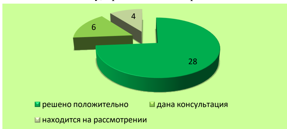
Диаграмма 2. Сведения об итогах рассмотрения обращений, поступивших мне в 2017 году.

Обобщенные сведения об итогах рассмотрения обращений, поступивших мне в 2017 году, приведены в диаграмме 2.