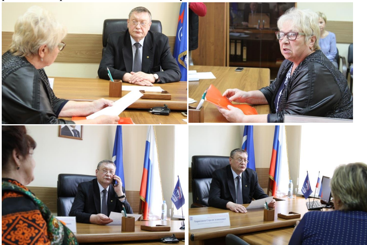
Прием граждан 07.07.2017 в приемной Председателя Всероссийской партии «ЕДИНАЯ РОССИЯ» в Тульской области

На этом же приеме заявителями были подняты вопросы о проведении ремонта дорожного покрытия улицы Первомайской в городе Алексине, об улучшении качества холодной питьевой воды в поселке Мичурино города Алексина, об оказании помощи в переводе участков, находящихся на территории Заокского района и на которых расположены дома граждан, из категории земель государственного лесного фонда в категорию земель населенных пунктов. Вопросы с ремонтом дорожного покрытия и улучшением качества питьевой воды удалось решить положительно совместно с администрацией муниципального образования город Алексин. Вопрос перевода земель из одной категории в другую требует проведения большой предварительной работы как администрацией муниципального образования Заокский район, так и министерства имущественных и земельных отношений Тульской области. Данная работа осуществляется, окончательное решение вопроса ожидается в 2018 году.