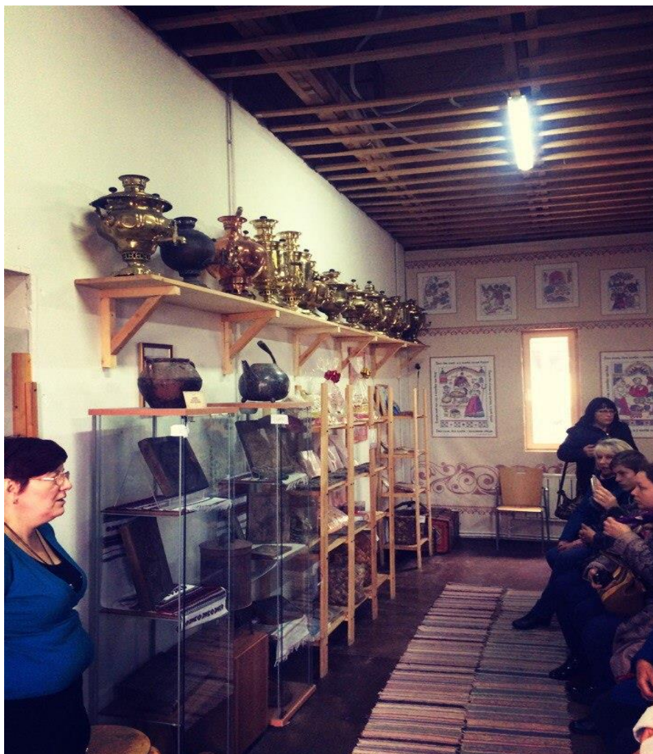
Государственный музей-усадьба Остафьево – Русский Парнас.