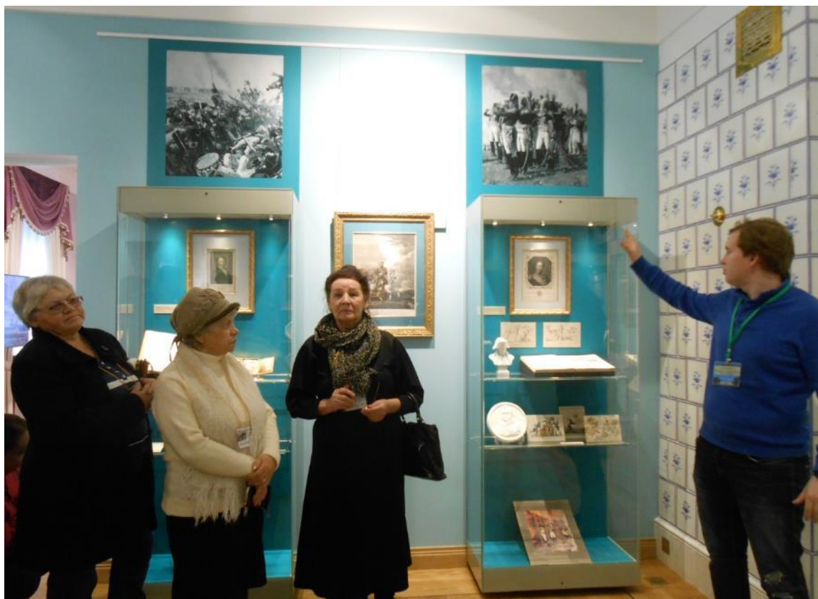
Организация встреч избирателей с известными людьми нашей области;