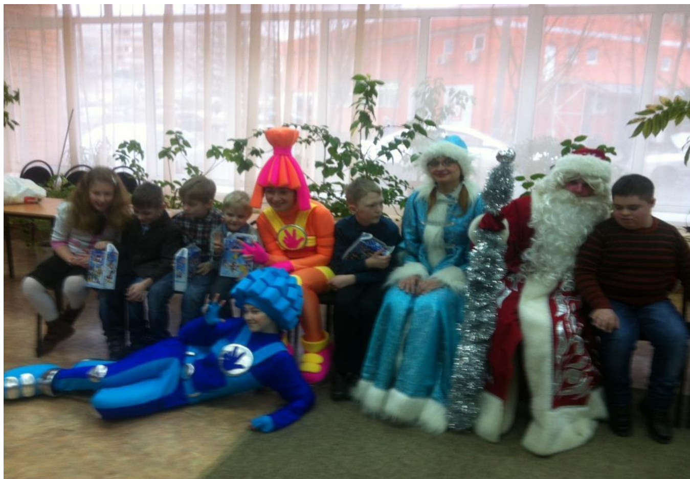
Поздравление с Новым годом детишек на дому