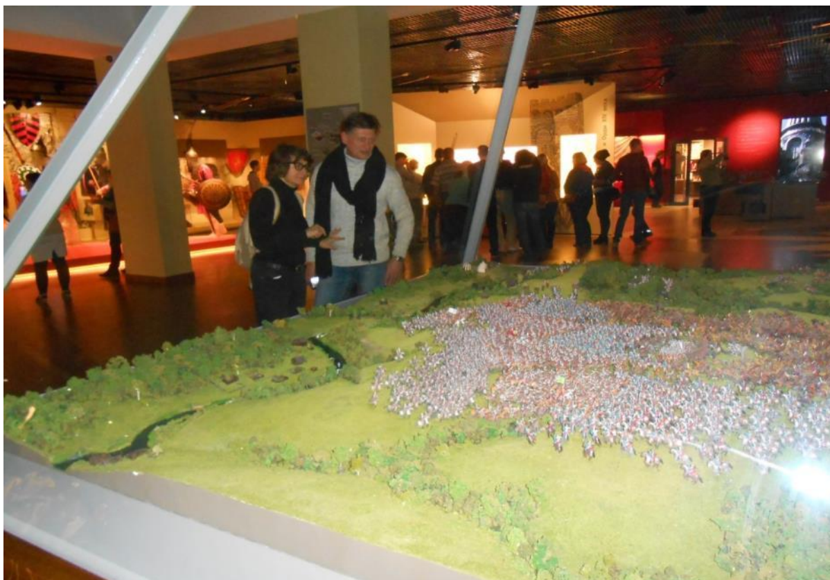
Музей Кремль в Измайлово