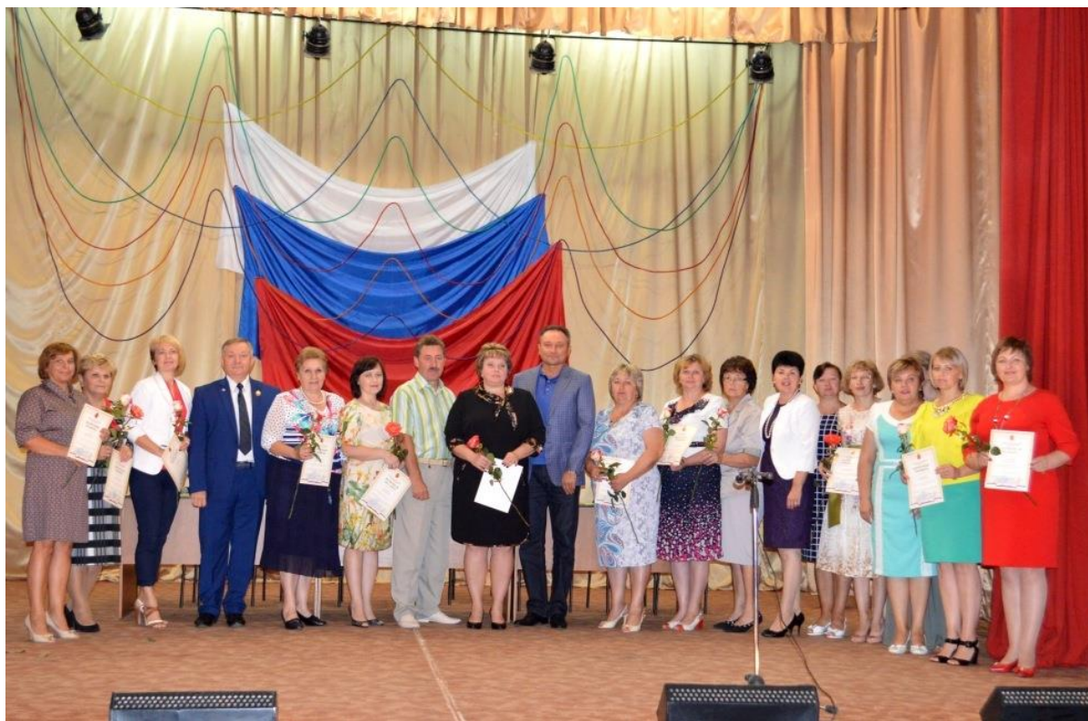
Встречи с представителями общественности округа.