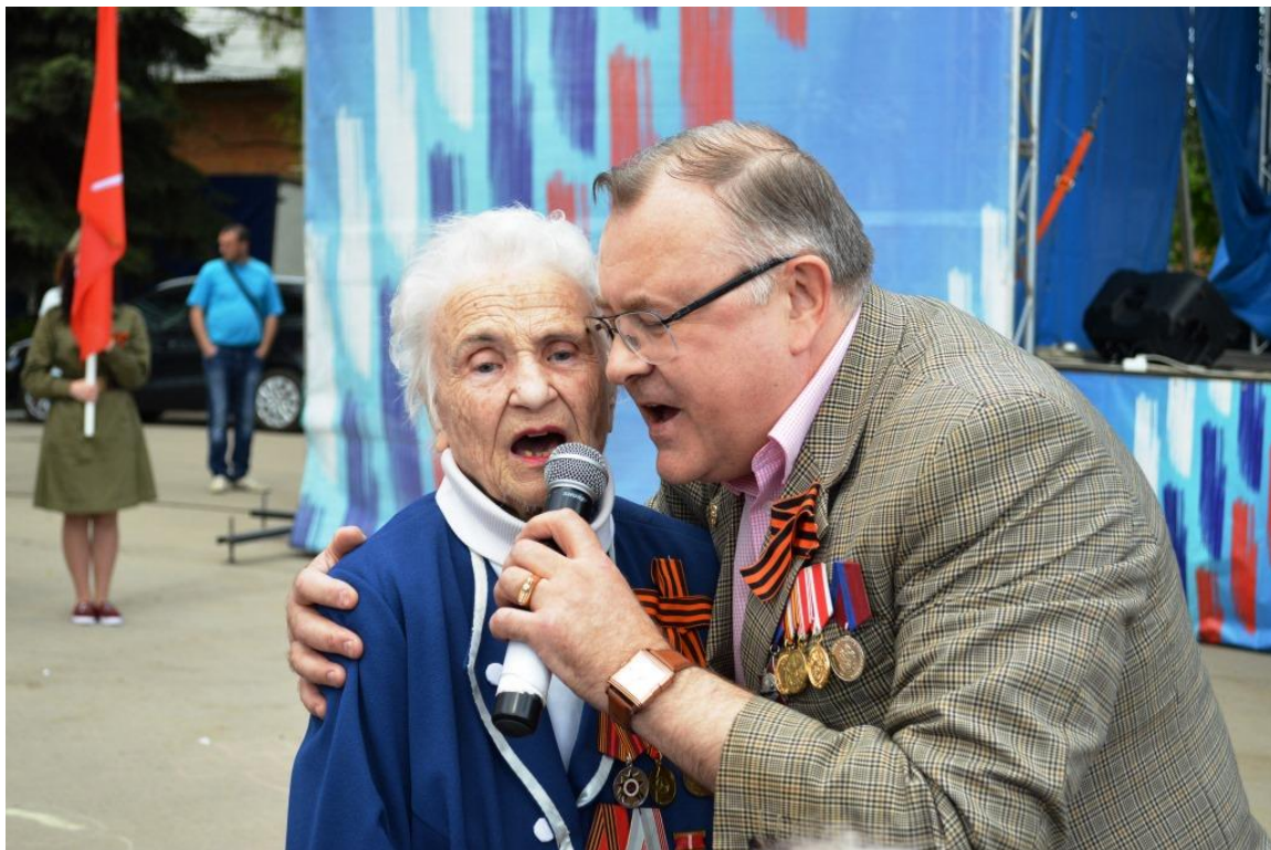
На торжественных мероприятиях ко Дню Победы в поселке Теплое.