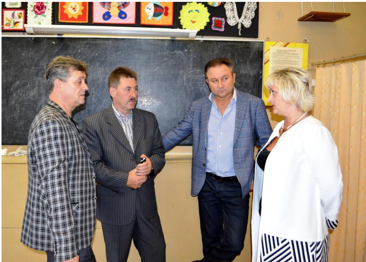
Участие в отчетно-выборной конференции Богородицкого отделения ТРО партии «Единая Россия».