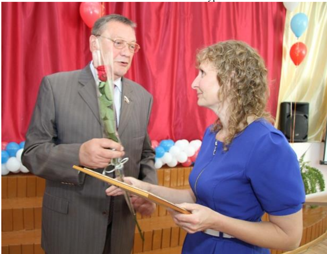
Встреча с учителями Заокского и Ясногорского районов, г. Алексин и пос. Новогуровский